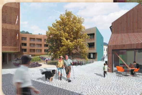
Pohled na vnitroblok Aparthotelu vč. budoucího přístavku restaurace penzionu

V prvním sloupci je název projektu, ve druhém, kdo je nositelem, investorem stavby. Třetí sloupec vyčísluje celkové investice (u staveb města vč. DPH; u soukromých bez DPH- jsou plátcí). Vlastní zdroje města vyjadřují, kolik do projektu muselo město vložit vlastních finančních prostředků. Poslední sloupec vyčísluje příjmy za prodeje jednotlivých nemovitostí. Z výsledku je zřejmé, že přes veškeré investice učiněné na malém kousku v centru města ve výši přes 340 mil. Kč, město ještě získalo na prodeji přes 18 mil. Kč a vložilo ze svého do projektů přes 13 mil. Kč, což znamená, že celkově je v plusu cca 5 mil. Kč.