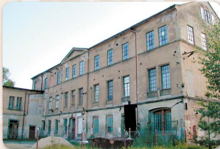
V roce 2005 na spadnutí