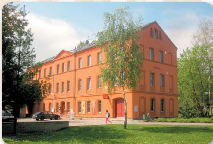
Od roku 2007 bývalá Továrna opět slouží