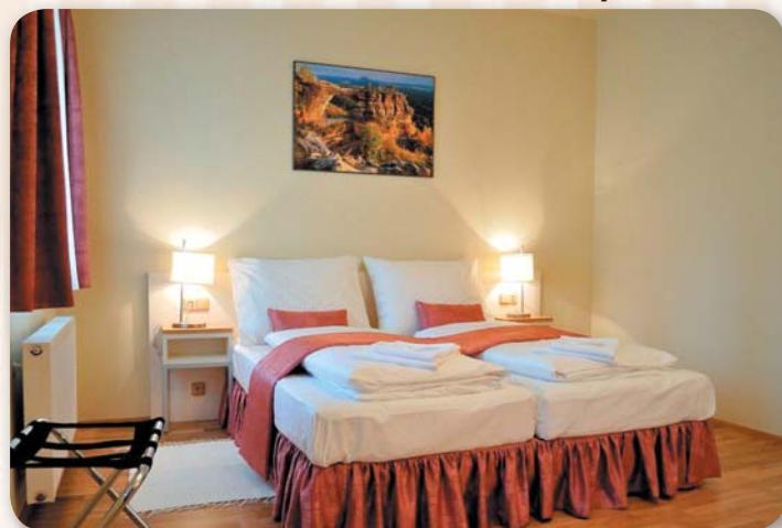
Luxus v penzionu