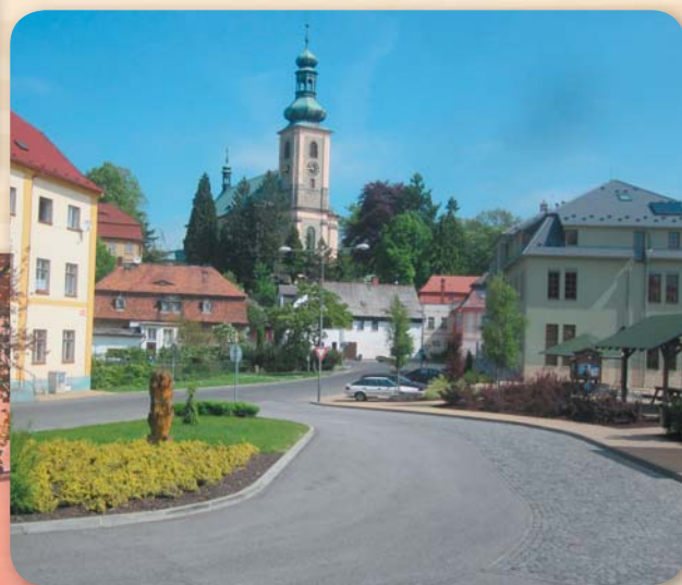
Otevírají se nové pohledy...