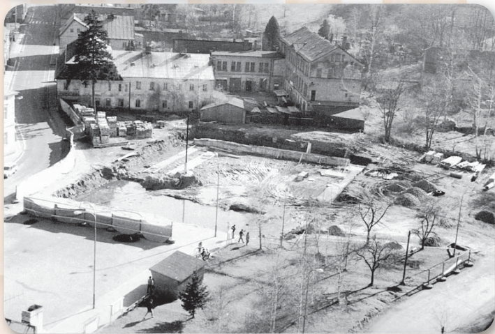
1990 - základy nákupního střediska