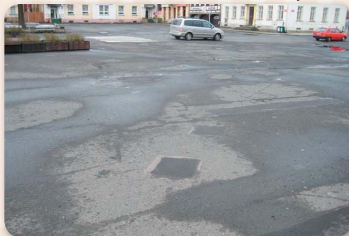
Náměstí bylo jedna velká asfaltem vyspravovaná plocha.