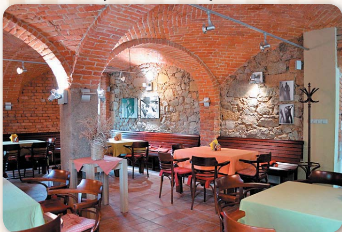
Klub v Továrně - nástupiště na bowling