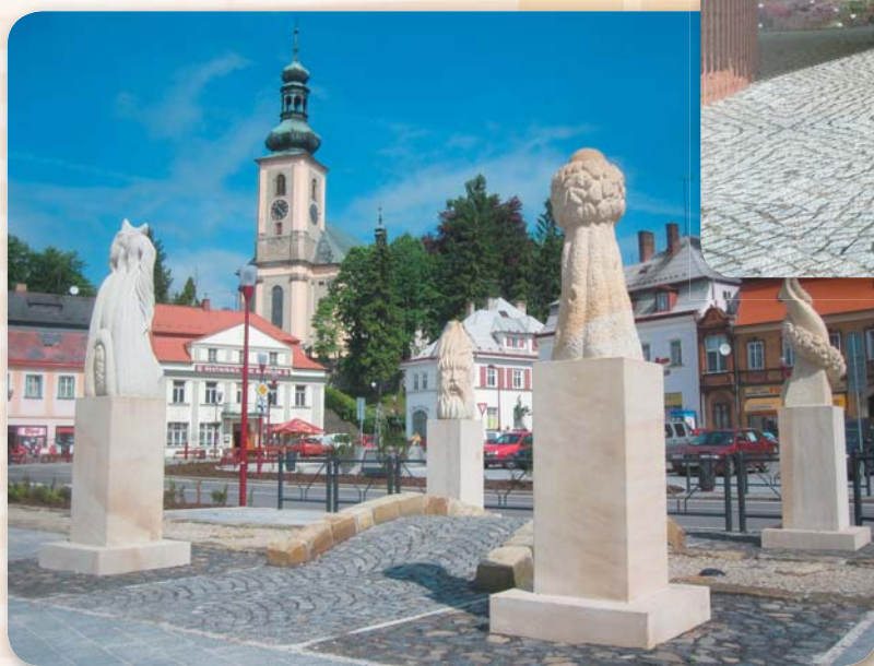
Symbolický mostek přes Křinici, jejíž tok je naznačen „kamennou řekou“. Čtyři sochy představují základní živly: voda, vzduch, země, oheň.