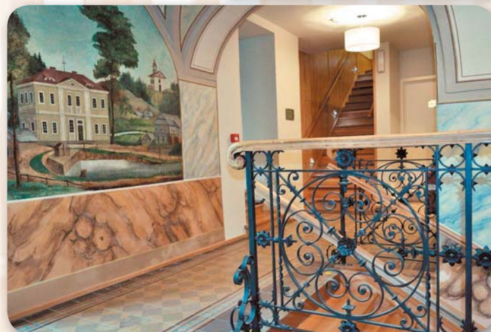
Nádherná renovace maleb a zábradlí v penzionu