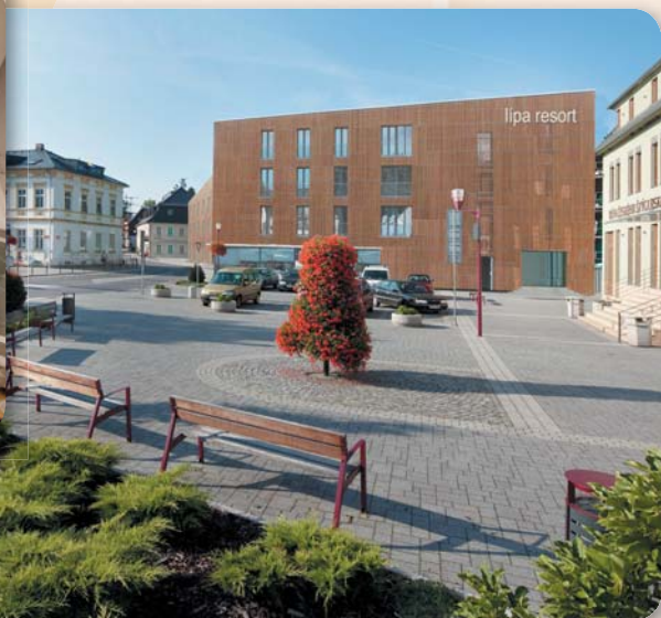
Výrazná proměna náměstí