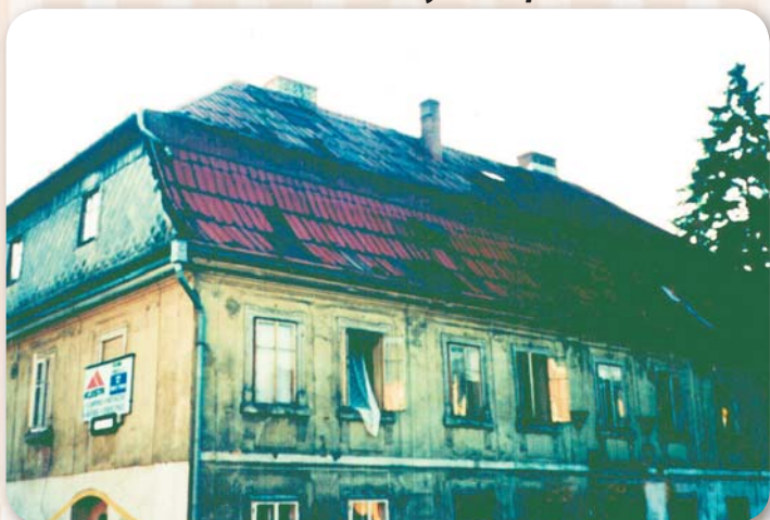
Objekt Pražská 4 před postupnou proměnou